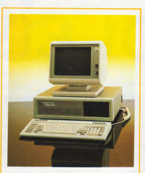
U.S. PRO XT

INTEL 80386 CPU, 16 MHZ 512 Kb RAM (on motherboard) 1.2Mb 5.25" floppy disk drive Combination Floppy/Hard disk Controller card High resolution Monochrome Graphics card Eight expansion slots (2-32 bit, 4-16 bit, 2-8 bit) 220 Watt power supply (110/220) AT style kevboard (Enhanced Keyboard option)