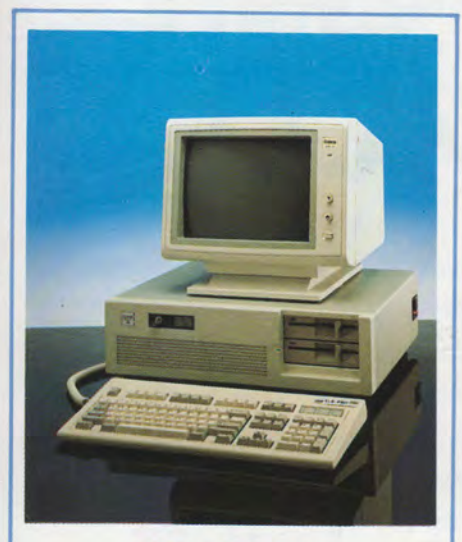
U.S. PRO 386

INTEL 80386 CPU, 16 MHZ 512 Kb RAM (on motherboard) 1.2Mb 5.25" floppy disk drive Combination Floppy/Hard disk Controller card High resolution Monochrome Graphics card Eight expansion slots (2-32 bit, 4-16 bit, 2-8 bit) 220 Watt power supply (110/220) AT style kevboard (Enhanced Keyboard option)